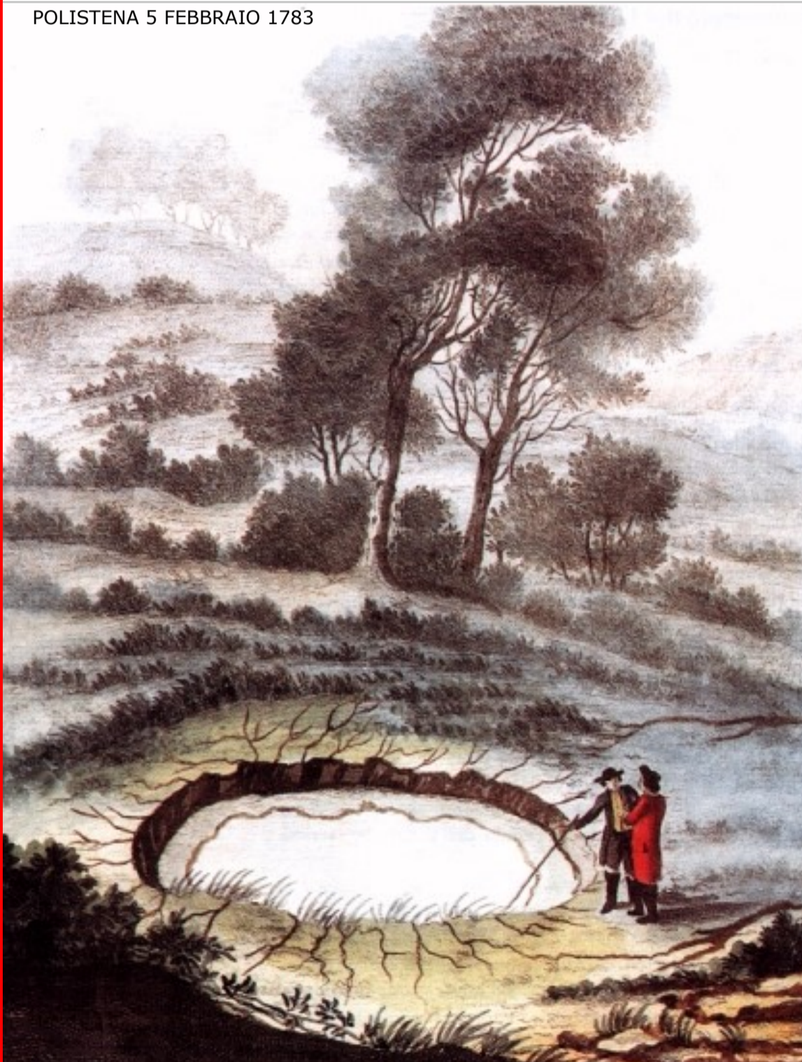
POLISTENA 5 FEBBRAIO 1783

Saluti del Sindaco di Polistena Dott. MICHELE TRIPODI